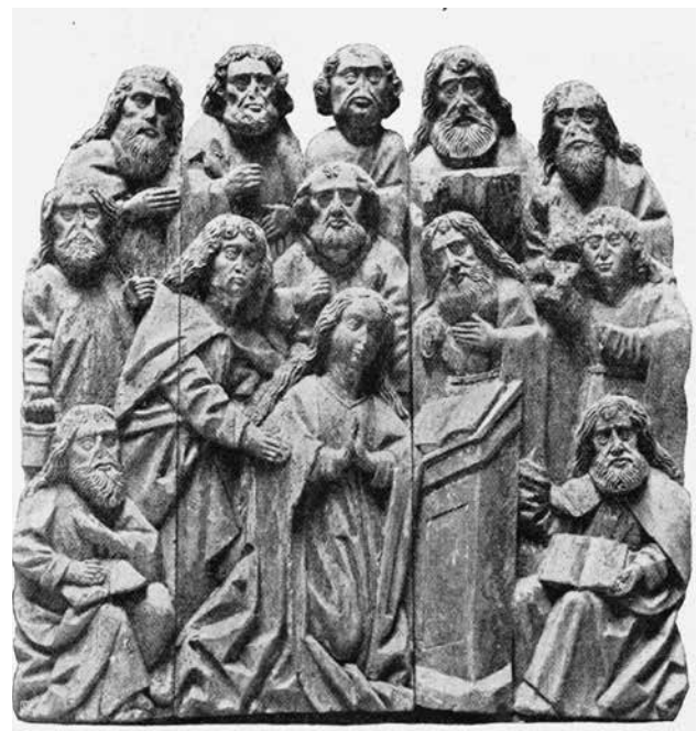
Abb. 6: Marientod aus Schlatten, wohl Troppau, um 1500, Lindenholz, H. ca. 120 cm, Troppau, Schlesi-sches Landesmuseum (Opava/Slezké zemské muzeum; Foto: Repro aus Braun 1910).

Da eine andere, triftigere Erklärung schon aufgrund fehlender Parallelen nicht unmittelbar auf der Hand liegt, kann nur aus der merkwürdigen Form des Stückes auf seine einstige Aufgabe geschlossen werden. Gehörte das Bildwerk vielleicht zur Rahmung einer Pforte und bildete dort den Teil eines Tympanons? Schließlich zählt das Weltgericht zu