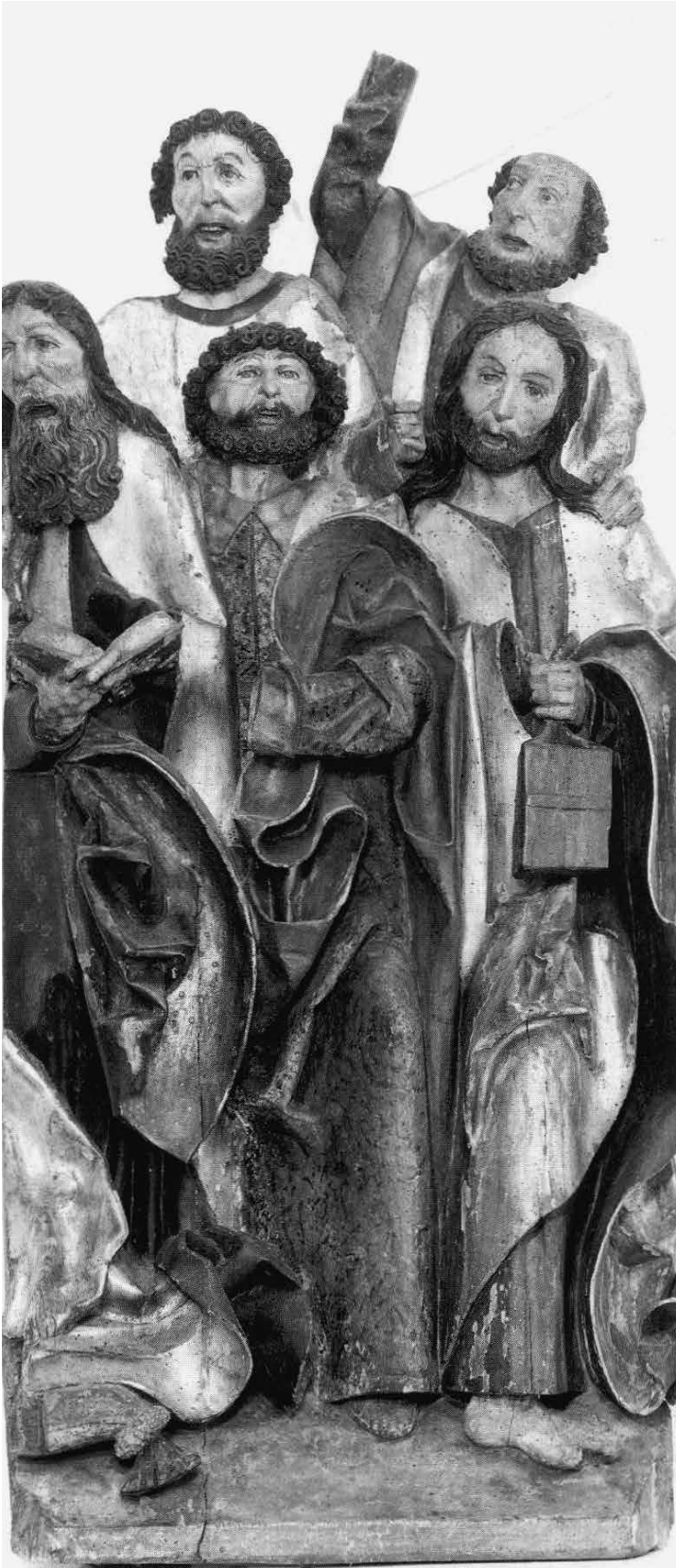
Abb. 4: Fragment eines Marientods, Schlesien, um 1500, Laubholz, polychromiert, H. 152 cm. Aachen, Suermondt-Ludwig-Museum, Leihgabe Sig. Ludwig (Foto: SLM, Aachen).

Stück vor etwa drei Jahrzehnten zu einem norddeutsch beeinflussten Werk, das in Mitteldeutschland „von einem Lübeck verbundenen Bildschnitzer auf seinem Weg in den Süden“ gearbeitet worden sein soll. Diese Zuweisung blieb triftige Belege schuldig und reflektiert schon in ihrer Umständlichkeit eine weitreichende Unsicherheit. Wo aber entstanden die beiden Bildwerke, wenn weder Süd- noch Mitteldeutschland dafür in Betracht kommen?