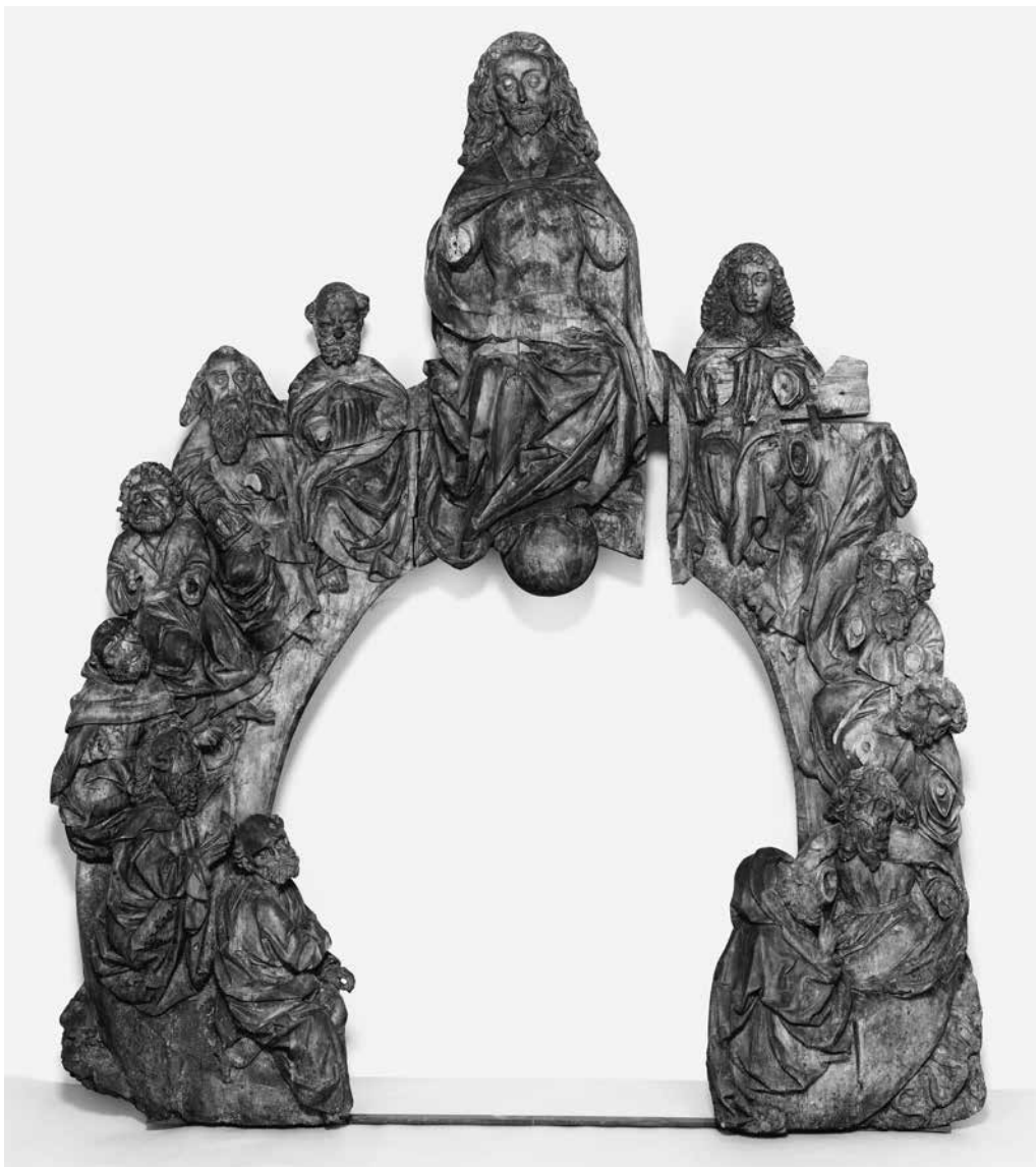
Abb. 1: Christus als Weltenrichter mit den Aposteln, Schlesien, um 1500, Lindenholz, Farbfassung verloren, H. 184 cm, B. 160 cm, Inv. Pl.O.2064 (Foto: Georg Janßen).

stammt. Schon 1853 war sie im Nürnberger Tiergärtnertorturm, dem ersten Domizil des Germanischen Nationalmuseums, ausgestellt. August von Eye (1825–1896) beschrieb die „bemalte Holzschnitzerei“ in dem in jenem Jahr edierten „Wegweiser“ durch die Sammlung etwas umständlich als „Himmelsglorie, ein Mittel-Altarbild“. Ein illustrativer Holzstich in dieser Broschüre führt es auf einer Konsole als Mittelpunkt eines pittoresken Arrangements aus mehreren, nicht zusammengehörigen Skulpturen und einem Bildtep-