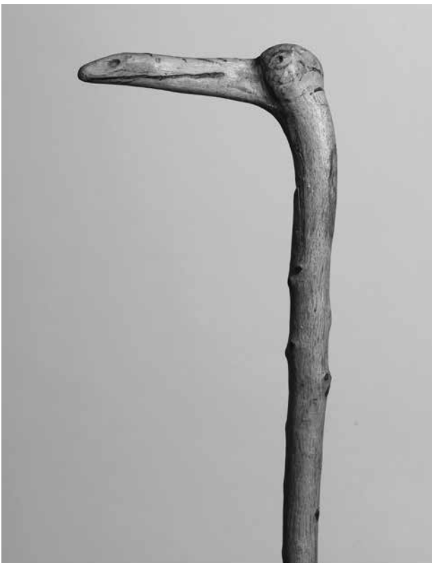
Abb. 2: Krummholzstock aus dem Kriegslazarett Jarny bei Metz, 1916, Detail, GNM, Inv. T 3556.

Der Kriegsalltag an der Front bestand im Wesentlichen aus einem für viele Soldaten schwer zu bewältigenden Wechsel zwischen der extremen Anspannung während der Gefechts-einsätze und dem nachfolgenden Wartezustand mit seiner zermürbenden Eintönigkeit. Der Schriftsteller Gustav Sack (1885–1916) schilderte in einem Brief an seine Frau Paula vom 20. Oktober 1914 seine ersten Tage an der Front: „[...] dann sogleich in den Schützengraben. Eigentlich kein Graben – es ist ein dichter Mischwald mit viel Unterholz, an dessen Rande alle 3–6 Meter jeder seine Höhle oder sein Schutzloch hat; [...] zum größten Teil selbst gebuddelt; auf dem Boden Stroh, ein alter Sack, in den man gerne hineinkriecht, und ein kleiner Haufen Lumpen, der als Kopfkissen dient. Ganz wohnlich, nur verteufelt kalt. [...] Der Dienst ist leicht – am Tag eine Stunde Posten und nachts einmal zwei und einmal eine Stunde Horchposten.“