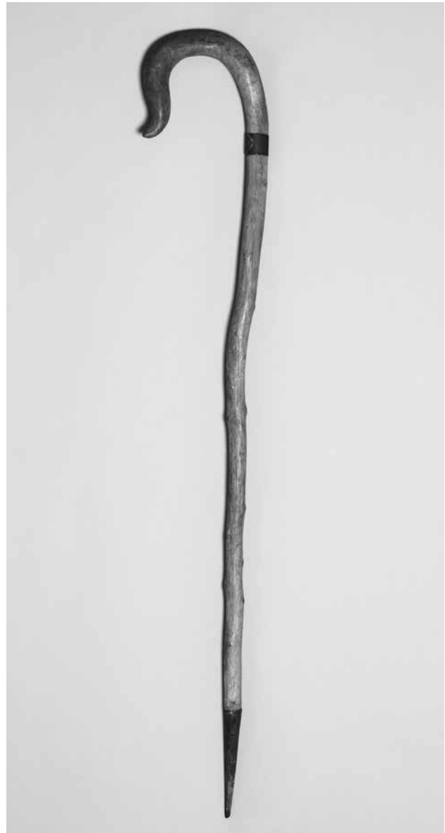
Abb. 3: Krummholzstock aus dem Kriegslazarett Jarny bei Metz, 1916, GNM, Inv. T 3552.