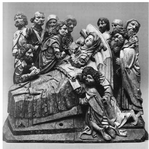
Abb. 3: Marientod, Schlesien, um 1500, Lindenholz mit alter Polychromie, H. 61,5 cm, B. 66,5 cm. Frankfurt, Skulpturensammlung Liebieghaus, Inv. 123.

Bezeichnenderweise wurde die Frankfurter Skulptur ebenfalls lange für süddeutsch gehalten. Da die Gesichter in ihrer derben Ausformung mit „tief liegenden, umschatteten Augen, vortretenden Backenknochen, gelegentlichen Krähenfüßchen und markanten Nasen“ jedoch keine Anhaltspunkte für den süddeutschen Raum gaben, erklärte man das