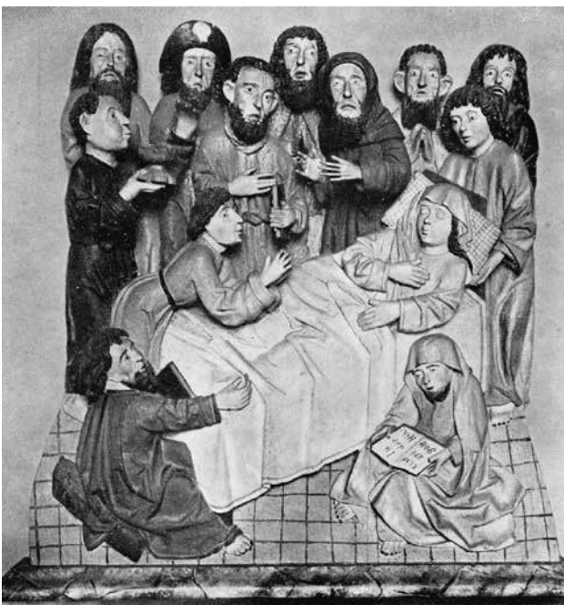
Abb. 5: Marientod aus Großherrlitz, wohl Troppau, um 1500. Lindenholz, H. ca. 120 cm, Troppau, Schlesi-sches Landesmuseum (Opava/Slezké zemské muzeum).

Die Werkstatt, aus der das aus Schlatten stammende Marienodrelief kam, könnte im etwa 20 Kilometer südöstlich von dort gelegenen Troppau gearbeitet haben. Die Stadt bildete im Mittelalter das politische und wirtschaftliche Zentrum dieses Gebiets. Das nach Nürnberg gelangte Weltgericht konkret dorthin zu lokalisieren, verbietet zwar der heute noch zu geringe Kenntnisstand von der kunstgeschichtlichen Entwicklung in diesem Raum. Dass es ebenso wie das in Frankfurt aufbewahrte Marienodrelief in diesem nördlich an Mähren angrenzenden Teil Schlesiens entstand, wird jedoch vom Befund der formalen Eigenheiten nahegelegt, die die dort erhaltenen Werke der Zeit um 1500 repräsentieren.