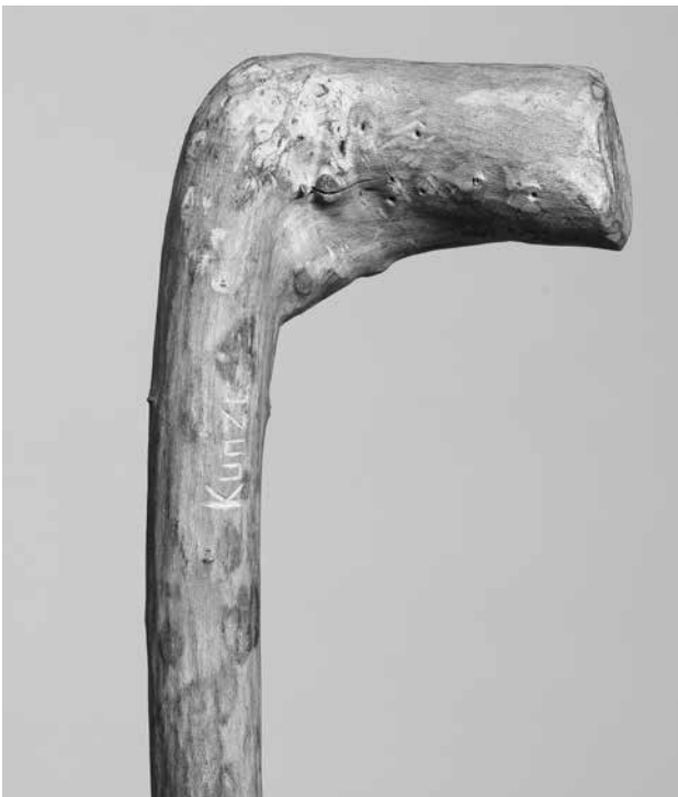
Abb. 4: Krummholzstock aus dem Kriegslazarett Jarny bei Metz, 1916, Detail, GNM, Inv. T 3554.