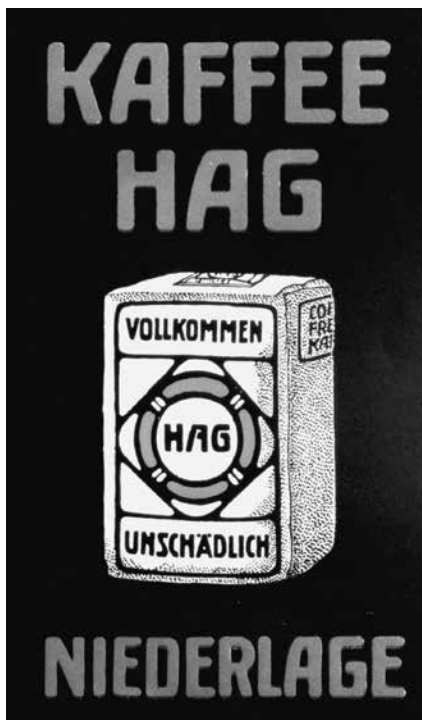
Abb. 3: „Unsere Friedens-Dauerreklame“, Kriegsblätter der Kaffee-Hag, Nr. 45, 15. August 1916, S. 5 (Scan GNM, Bibliothek).

Zudem stellte Kaffee HAG mehrfach Feldpostkarten mit Firmenlogo zur Verfügung und bat darum, diese auch – vorzugsweise nicht für Zuschriften an die Firma – zu