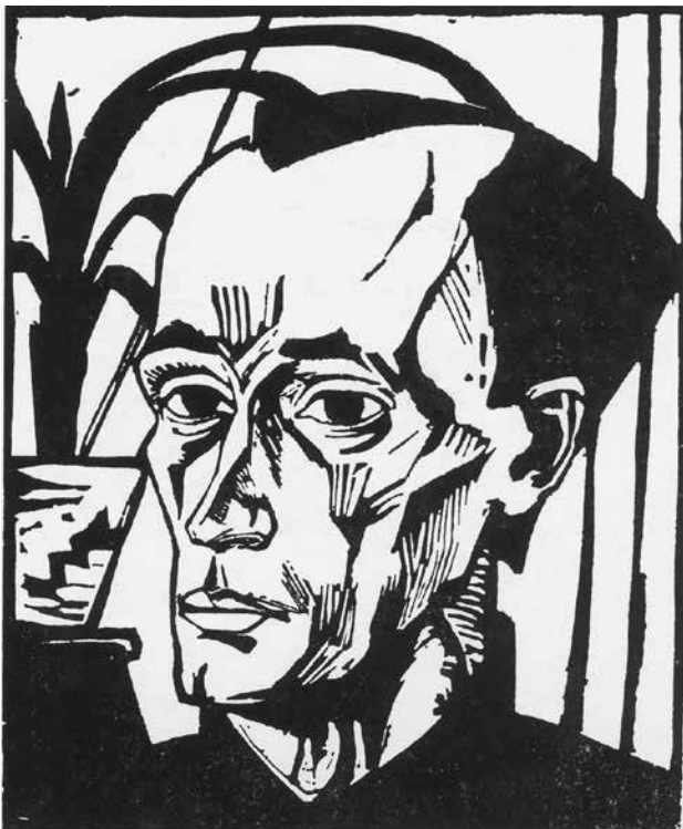
Abb. 2: Erich Heckel, Bildnis E. H., 1917, Holzschnitt, Motiv: 36,8 x 29,8 cm (© Nachlass Erich Heckel, Hemmenhofen).

Mit diesem Holzschnitt, der 1978 als Geschenk aus Privatbesitz in die Grafische Sammlung kam, bewahrt das Germanische Nationalmuseum ein druckgrafisches Unikat. Es handelt sich um ein Selbstporträt des bekannten Künstlers, von dem nur dieses eine Exemplar bekannt ist und das sowohl in dem 1964 von Annemarie und Wolf-Dieter Dube publizierten Werkverzeichnis wie auch in späteren Katalogen fehlt. Auf den ersten Blick lässt dieser Umstand an der Authentizität des Blattes zweifeln. Es fügt sich jedoch stilistisch wie technisch widerspruchlos in eine Reihe von Männerbildnissen ein, die Heckel 1917 schuf. Insbesondere ähnelt es einem in diesem Jahr in Holz geschnittenen Autoporträt, auf dem sein von kräftigen Schatten und Linien geprägtes Konterfei nach links aus dem Bild blickt (Dube 306, Abb. 2). Auch hier trägt der Dargestellte ein dunkles, hochgeschlossenes Hemd oder einen Pullover, der das Bild zum unteren Rand hin abschließt. Im Hintergrund ist eine Topfpflanze dargestellt, vermutlich eine Clivia ohne Blüten, die wie die Schlumbergera motivisch an die Kakte- und Amaryllisgewächse der Malerei der Neuen Sachlichkeit erinnert. Die Blätter der Pflanze ragen über den Kopf des Künstlers und verschaffen ihm so mehr Freiraum. Es ist