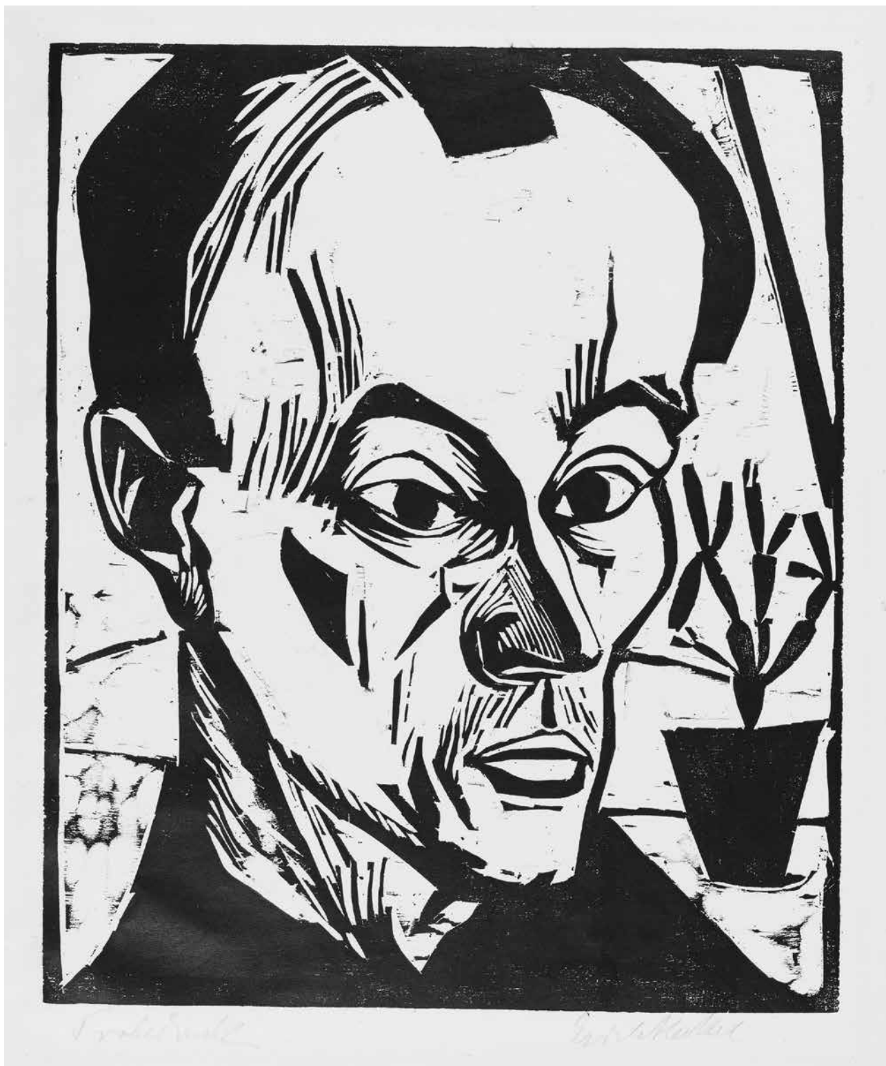
Abb. 1: Erich Heckel, Selbstbildnis mit Kaktus, um 1917, Holzschnitt, Motiv: 36,6 x 30,3 cm, Blatt: 43,8 x 35,0 cm. Sign. unten rechts: Erich Heckel; eigenhändig bez. unten links: Probedruck; von fremder Hand (?) bez. u. r.: 700 (Bleistift), Inv. H 7980, Kapsel 1464.