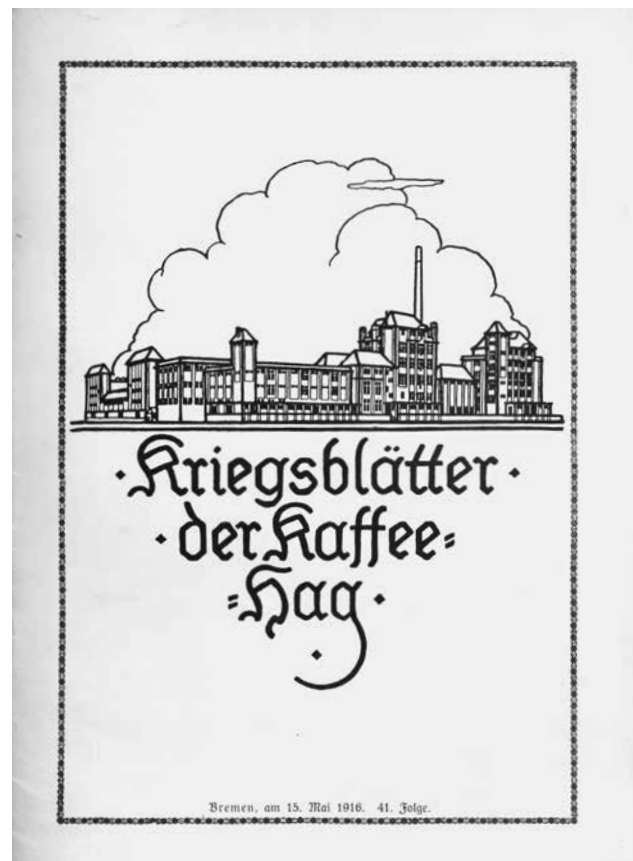
Abb. 2: Kriegsblätter der Kaffee-Hag, Nr. 41, 15. Mai 1916, Titelseite. GNM, 4°G 4000ged.

Ab Nr. 41 rückt die leicht veränderte Ansicht ins Zentrum der mit einer Schmuckbordüre gerahmten Titelseite der Kriegsblätter; darunter der typografisch modern gestaltete Zeitschriftentitel (Abb. 2). Der Schmuckrahmen zierte auch die Seiten im Innern. Der Umfang der nun in 14-tägigem