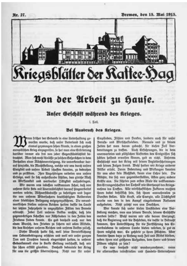
Abb. 1: Kriegsblätter der Kaffee-Hag, Nr. 27, 15. Mai 1915, Titelseite. GNM, 4°G 4000ged.

genstärke liegen keine Informationen vor. Da sich das Blatt jedoch explizit an die eingerückten Mitarbeiter richtet, zahlreiche persönliche Beiträge enthält und viele Anspielungen nur von Betroffenen verstanden werden konnten, ist davon auszugehen, dass der Adressatenkreis tatsächlich vorwiegend auf die im Titel Genannten beschränkt blieb und sich maximal noch auf die daheim gebliebenen Mitarbeiter erstreckte. Daher ist von einer Auflage zwischen 120 und 250 Exemplaren auszugehen.