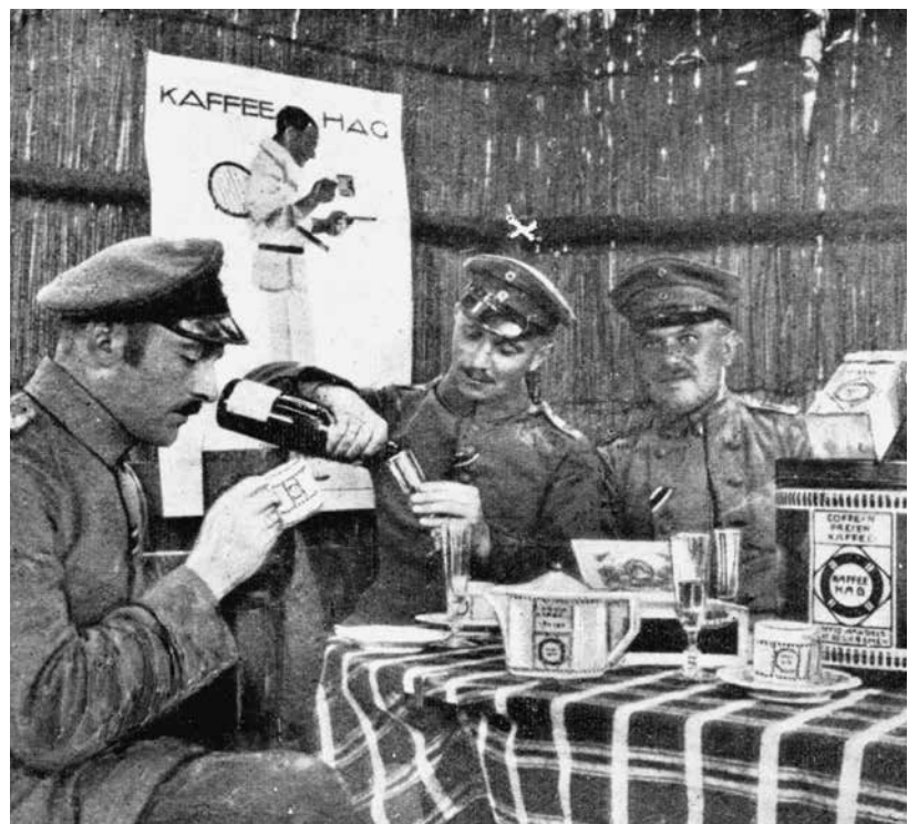
Abb. 4: „Kaffee Hag im Felde“, Kriegsblätter der Kaffee-Hag, Nr. 44, 15. Juli 1916, S. 7.